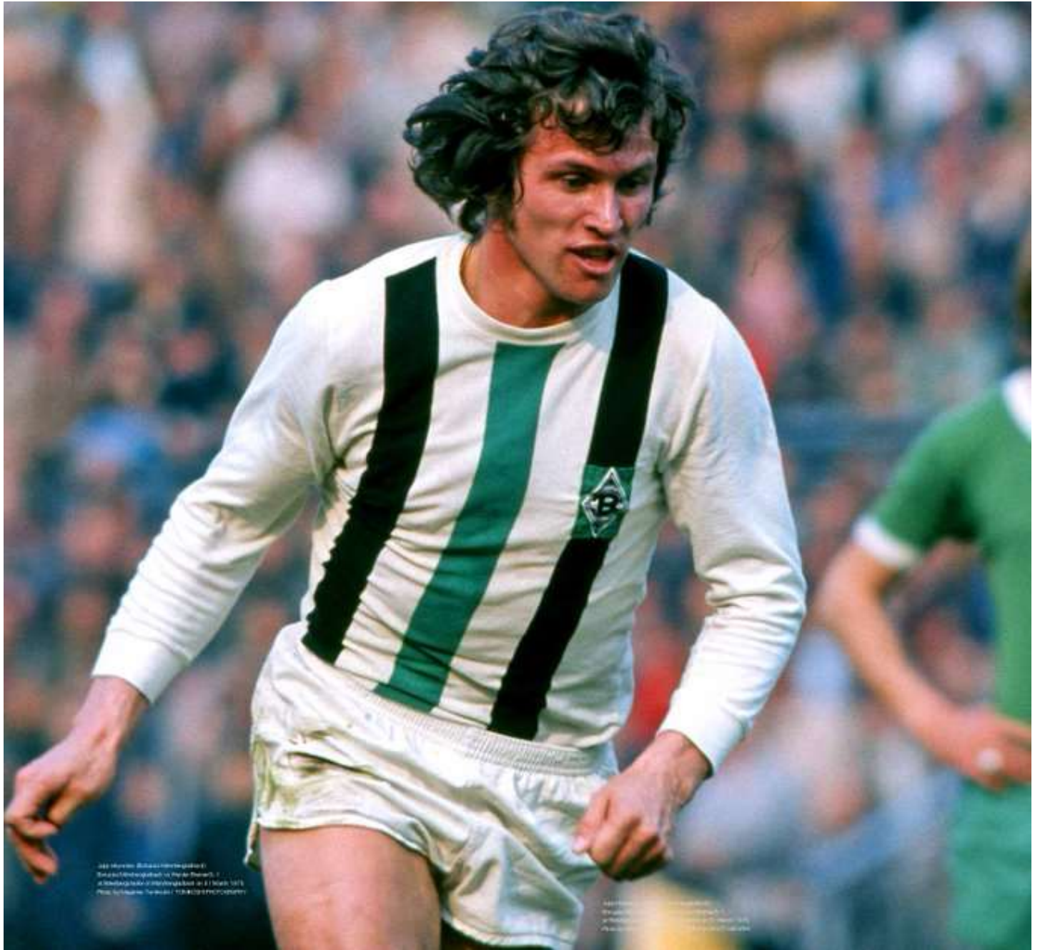
1988 München: Fußball-Weltmeisterschaft Brasilien gegen Italien im Finale. Der Spieler ist im Bild zu sehen. Er trägt ein weißes Trikot mit grünen Streifen. Foto: Schöner, T. / D. W. / D. W. / D. W.

Das Bild zeigt einen Spieler im weißen Trikot mit grünen Streifen, der in Aktion ist. Er trägt ein weißes Trikot mit grünen Streifen. Foto: Schöner, T. / D. W. / D. W. / D. W.